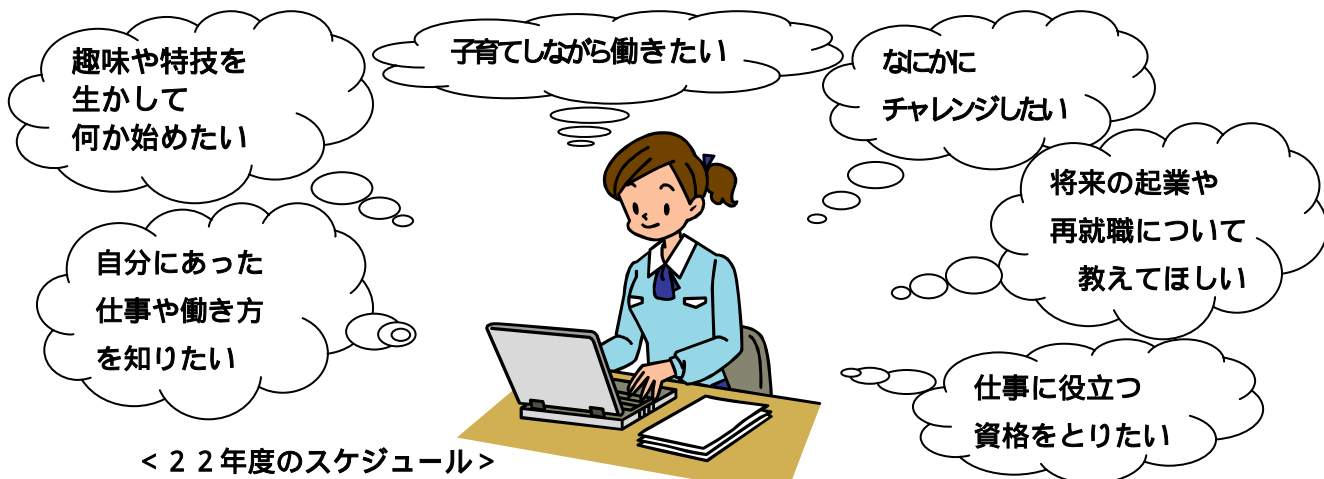
< 22年度のスケジュール >

「働きたい」、「起業してみたい」、「何かを始めたい」そんな様々なチャレンジを希望する女性のための無料個別相談です。女性相談員が、豊富な経験に基づいてアドバイスや情報をご提供し、あなたに合ったプランづくりをお手伝いします。どうぞお気軽にご相談ください！